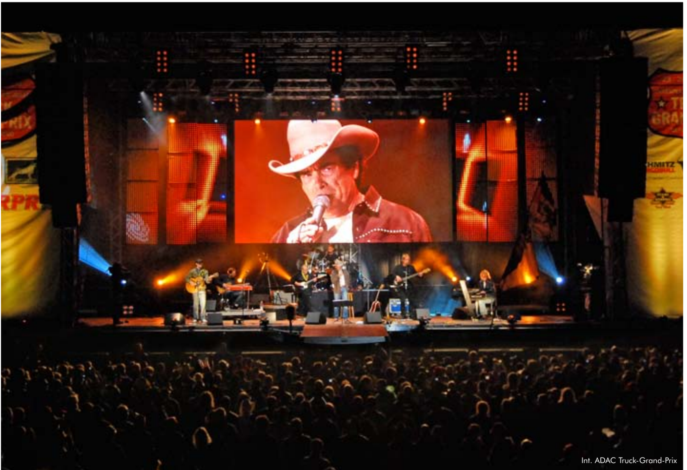
Int. ADAC Truck-Grand-Prix