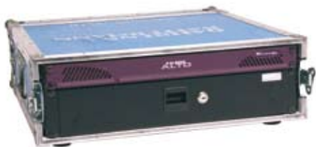
Abb. zeigt Kaleido Alto mit Bildsplittfunktion