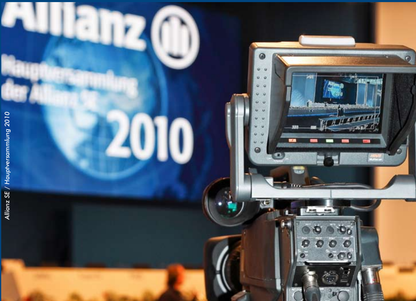
Allianz SE / Hauptversammlung 2010