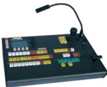
Abb. zeigt Controlpanel

Inputs: freely configurable for HDSDI, SDI, DVI, RGBHV, YUV, Y/C and FBAS